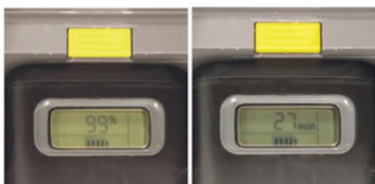
リアルタイムテクノロジー

現在業界的にはコロナによる未曾有の危機に晒されていますが、私共は清掃機器を通して本格的な働き方改革のお手伝いをし、共存共栄の道を皆様と歩んでまいります。なんなりとお気軽にご相談下さい。 今回ご案内したマシンにおいては従来通りデモンストレーションをさせていただけの準備もしております。お気軽にお声がけいただき、実機で性能や使用感の確認などいただければ幸いです。