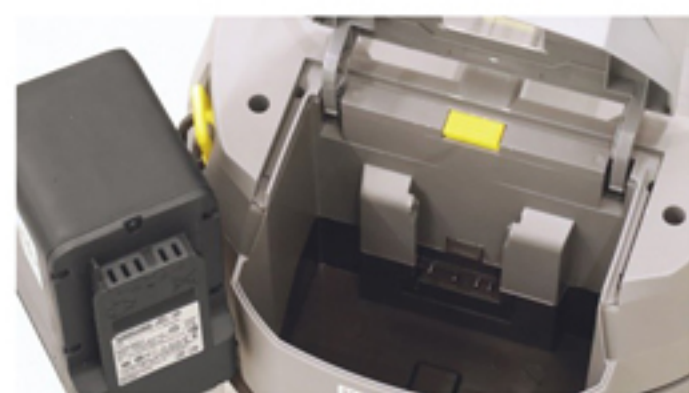
安心安全のバッテリーロック機構

ケルヒャーは今後同じバッテリーで動くマシンを続々とリリース致します。今回の高圧洗浄機と乾湿両用掃除機のバッテリーで乾式掃除機や小型床洗浄機が使えるように近々マイナーチェンジします。下期に向けてはカーペットスライパー等もリリース予定です。ケルヒャーバッテリーユニバースと銘打って、今後お客様の清掃の在り方に革新的な変化をもたらしていきます。