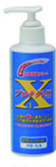
200ml | 中型容器