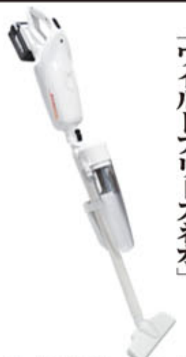
ワイルドブリーズネオ 定価：42,000円(税別) ※3月中旬発売予定

特長①紙パック+サイクロンユニットを標準装備で目詰まりを防ぎ吸引力を持続します。