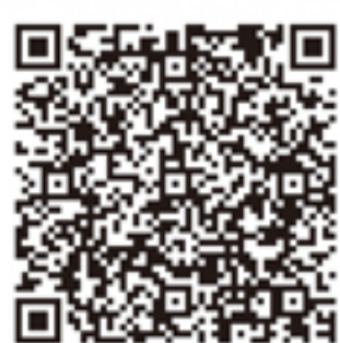
オートモップ 動画