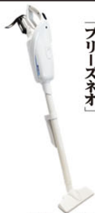
ブリーズネオ 定価：22,000円 (税別)

この度モデルチェンジ致しましたは「ブリーズネオ」・「ワイルドブリーズネオ」をご紹介させていただきます。