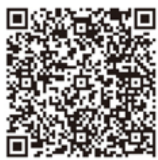
パワーモップ 動画