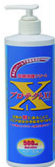
500ml | 大型容器