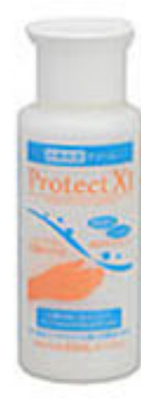
80ml | 小型容器