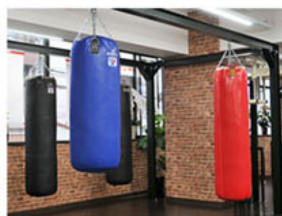
ファイティング山川

以上、つらつらと書いてきましたが、ご興味のある方は、「西岡利晃GYM」で検索頂ければ、ホームページがあります。見学も随時できるようですから、ご連絡頂ければと思います。厳しい状況が続きますので、ストレス解消しながら、共に頑張りましょう!