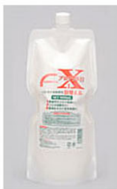
900ml | 詰替

プロテクトX1は3〜4時間の間は手洗いしても保護成分が落ちません、ハンドクリーム類は手洗い後に塗り直します。ご興味・手荒れが気になる方は一度弊社担当営業にお声かけ下さい。宜しくお願い致します。