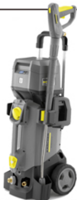
高圧洗浄機 HD4/11C BP