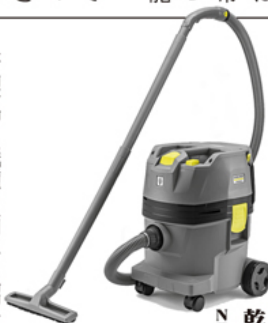
乾湿両用掃除機 NT22/1AP BP

それぞれの製品詳細については弊社ホームページからカタログの参照と、製品動画をご覧ください。